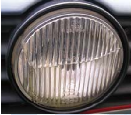
Gat in glas