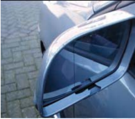
Aantasting van de lak door een van buiten komend onheil