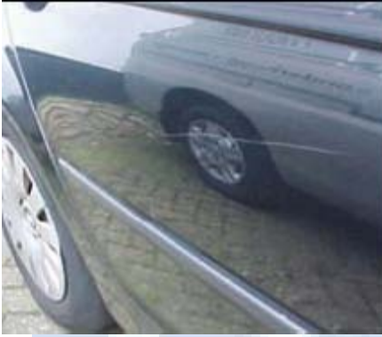
Schade veroorzaakt door een aanrijding